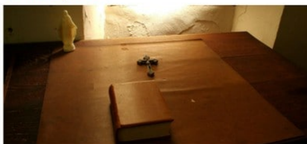
En 2016, RCF a choisi le thème de la sobriété pour accompagner ses auditeurs tout au long du carême

[Carême] La sobriété, nouveau nom du jeûne ? 🐦 📘 📺 🎧