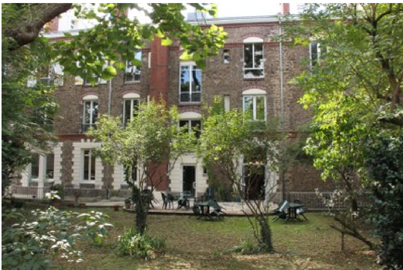
Le bâtiment du Défap, vu depuis le jardin

Au Défap, l'hospitalité n'est pas un vain mot. Que ce soit pour voir ou revoir Paris, le Défap vous accueille désormais dans cette maison historique commune qu'est le service protestant de mission : jeunes avec leurs pasteurs, animateurs, catéchumènes, paroissiens... Des week-ends et mini-séjours « découverte » sont dès à présent proposés.